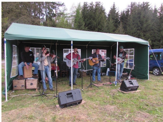
Další fotografie lze nalézt na webových stránkách naší obce.