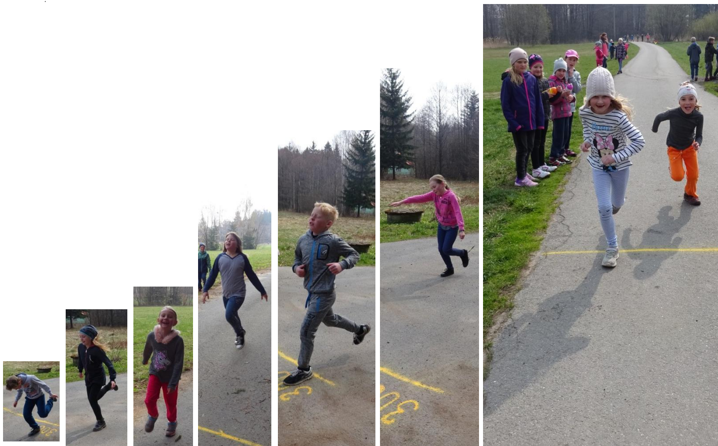
I.kategorie 100 m, 1. – 3. místo

Běželo se bezhlavě, po jedné, vysmátě, vznešeně, ze všech sil, tam, ... i s vypláznutým jazykem. Kdo neběžel, fandil.