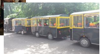
- za odměnu jsme jeli na výlet do Perníkové chaloupky, ježibaba nám všechno ukázala a odměnila nás sladkým perníčkem, ale nejlepší byla jízda vláčkem kolem Kunětické hory