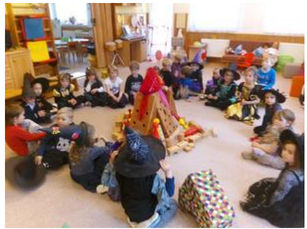
- čarodějky prolétly i kuchyní a pak si zapálily i oheň