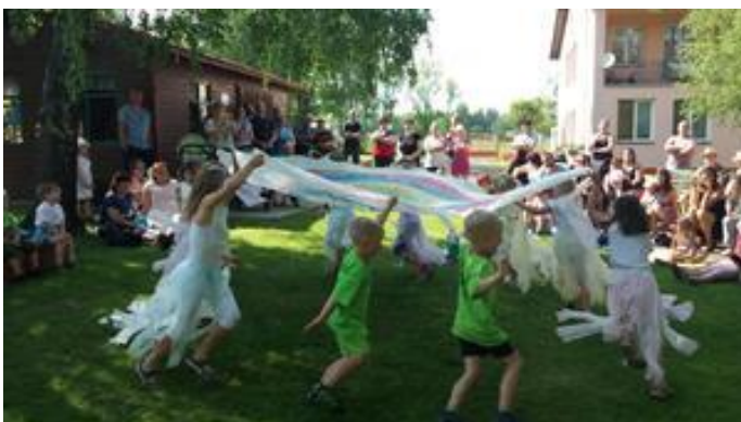
- na mamčin svátek se pečlivě připravujeme, ozdobené srdíčko, vyrobená kytička a dáreček z keramiky potěší každou maminku i babičku. K tomu jsme krásně zaspívali, zatancovali a společně si pochutnali na dobrůtkách od maminek. Bylo to krásné odpoledne.