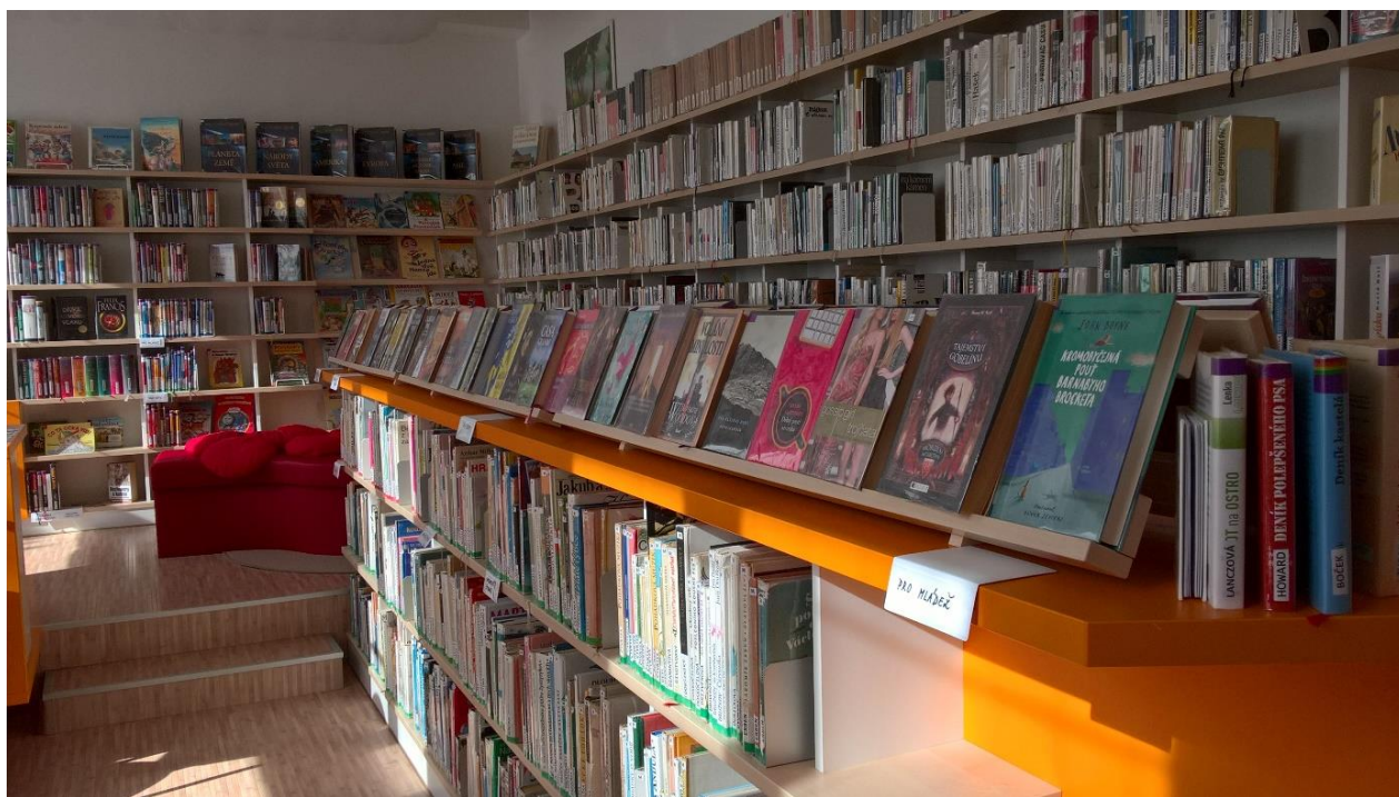
Květa Honzálková -Knihovna Borová

Na čtenáře současné i budoucí se knihovna opět těší od 20. srpna od 13.30 – 16.30 hodin.