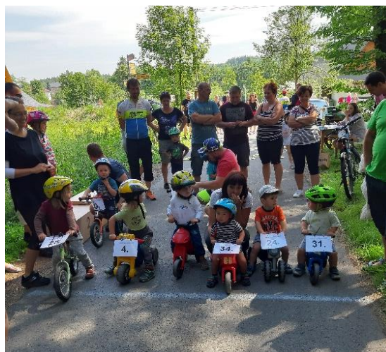
Tým pořadatelů cyklistického oddílu Sokol Borová