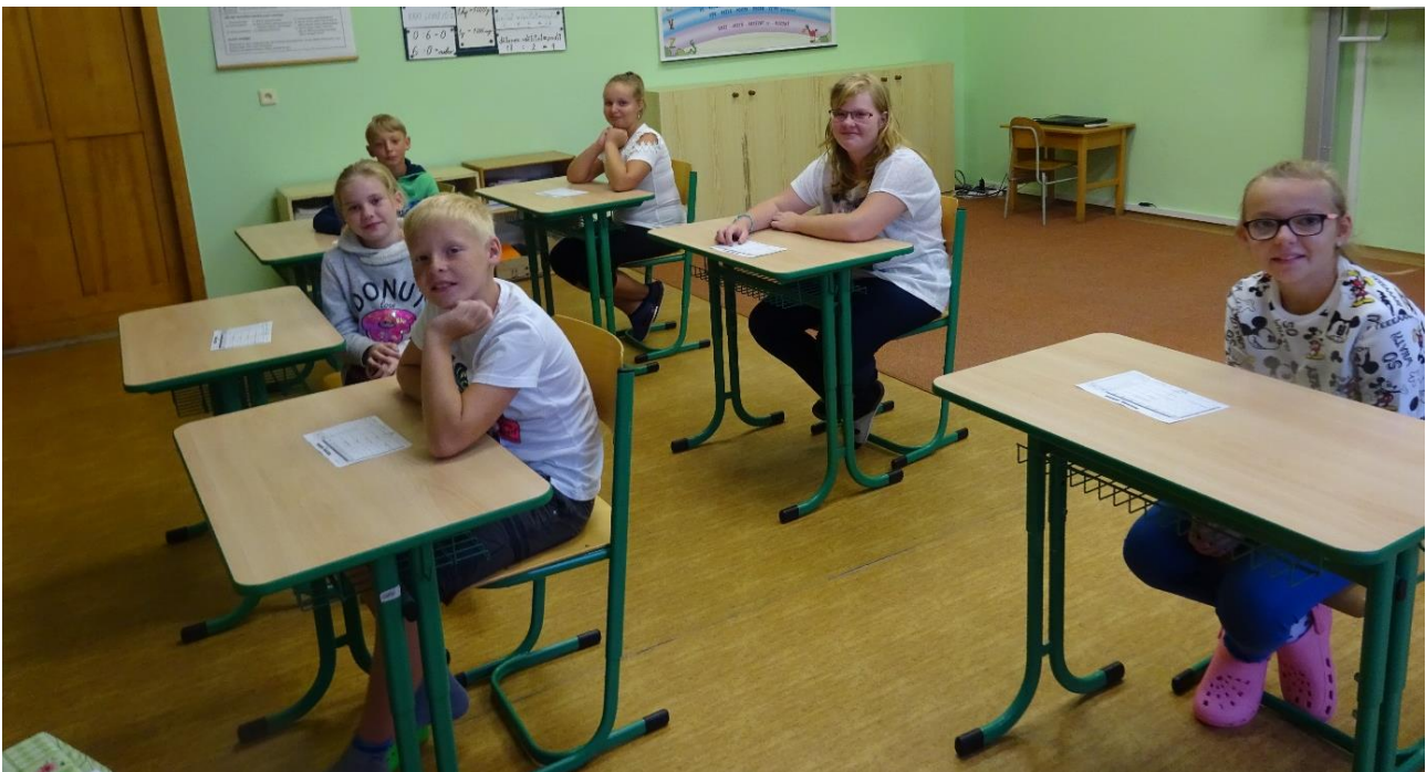
Naši pátáci. Také ještě nejsme všichni.