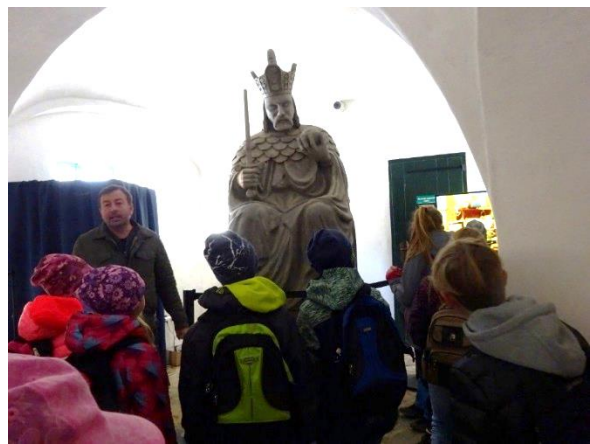
Konečně jsme se dostali před samotného Karla IV. v nadživotní velikosti.

A potom už nás čekala stará konírna plná zajímavých exponátů a informací - ti odvážnější si během prohlídky sáhli i na popravčí meč.