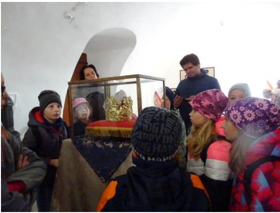
Kopie pohřební koruny Přemysla Otakara II.