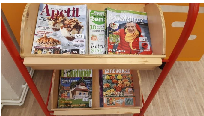
Květa Honzáková - Knihovna Borová

V knihovně jsou nyní k zapůjčení také starší čísla některých časopisů, které nám darovala poličská knihovna.