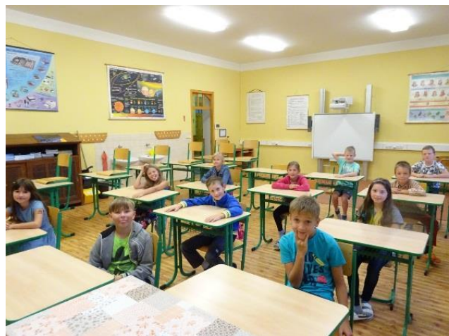
Zbytek třídy je nemocný nebo ještě na prázdninách? Přemýšleli čtvrtáci.