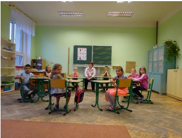
Už jsme druháci, koukejte!