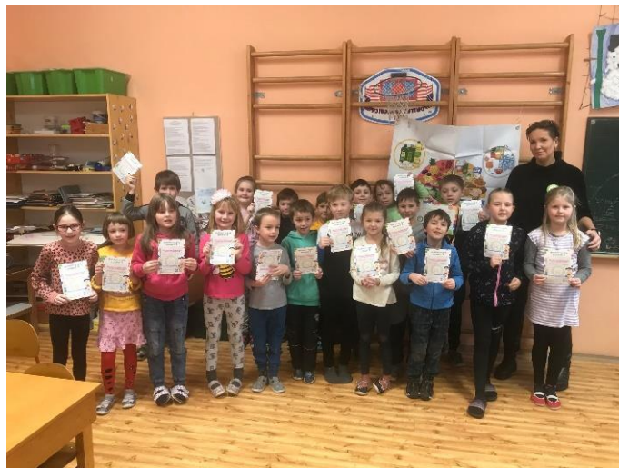
Beseda o tom, jak na správnou stravu.