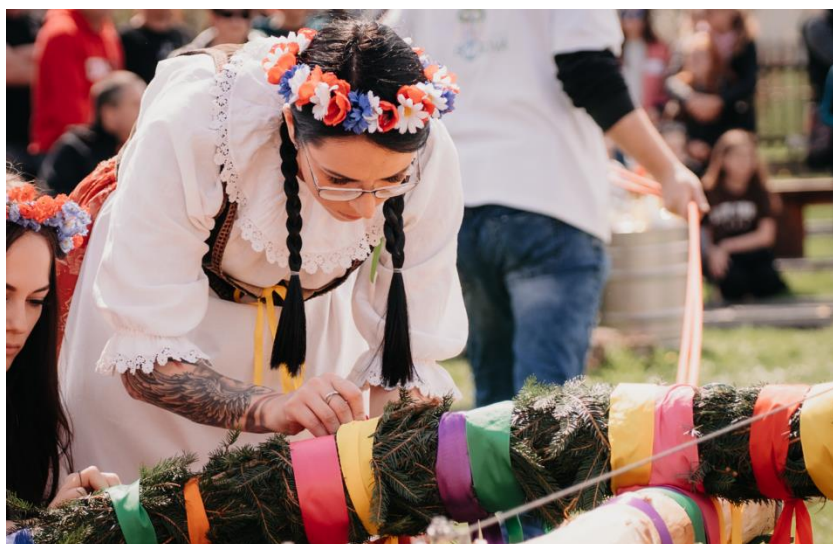
Dozdobení kruhu děvčaty před postavením máje