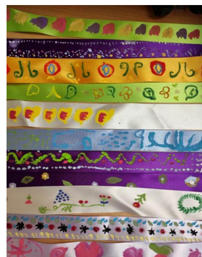
Malované od MŠ, ZŠ, Seniorek a Klubíku