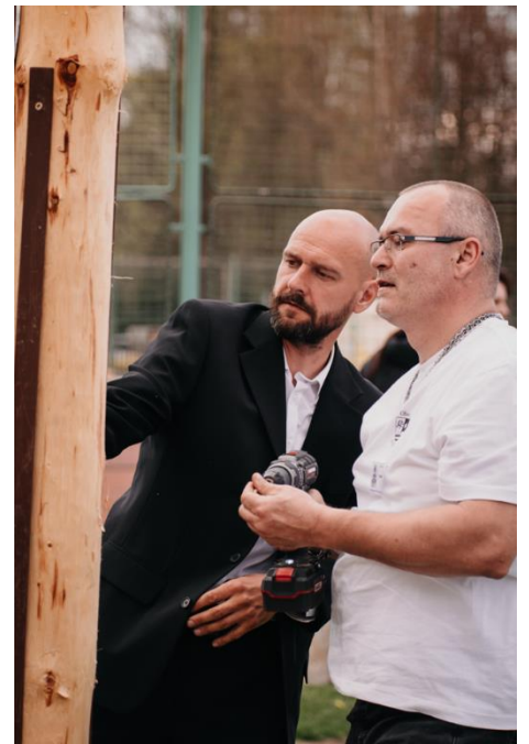
Přísná kontrola po postavení 😊