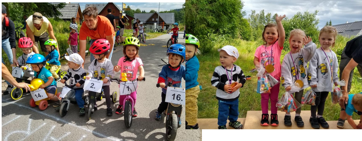
Za sokol Borová Just J.