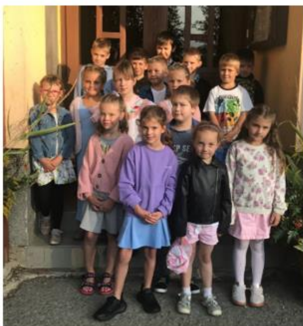
Už nejsme ve škole nejmladší.