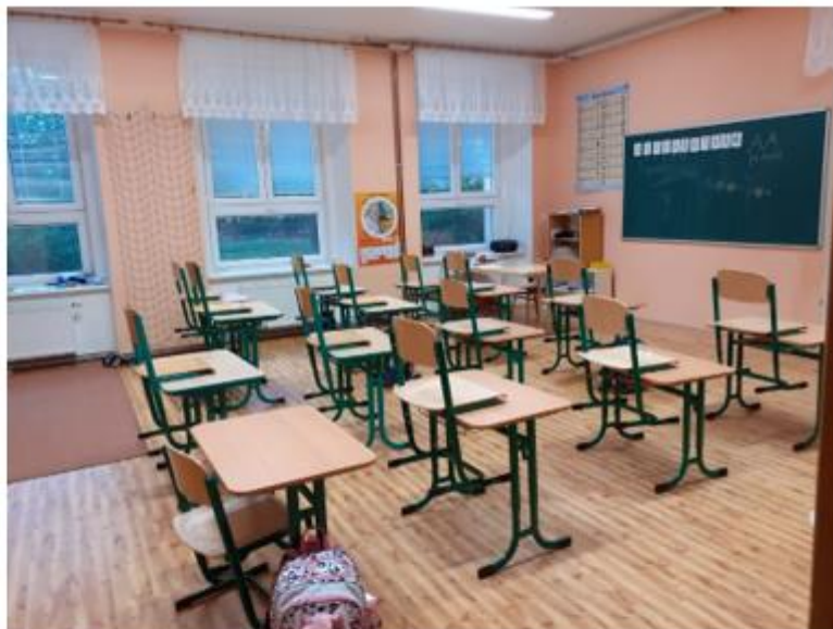
Učebna pro prvňáčky – bývalá školní družina.