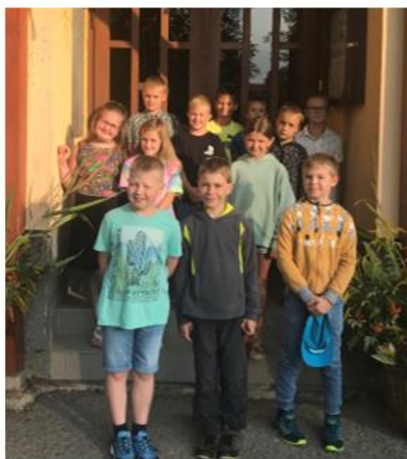
My jsme právě uprostřed.