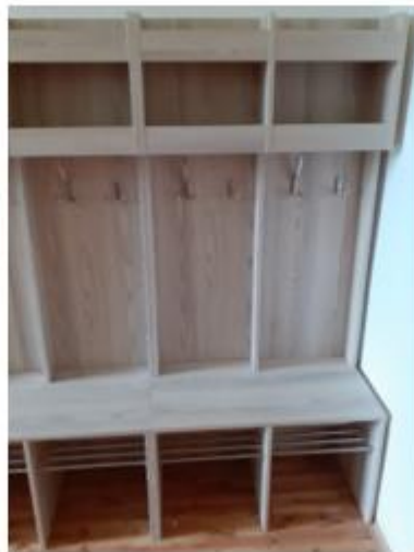
Detail nového modulu.