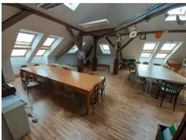
Školní družina v podkrovní škole.