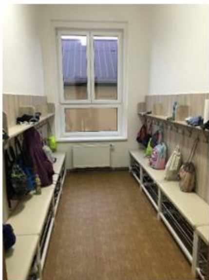
Třetí šatna, která vystřídala školní knihovnu, nyní již „zabydlená“.