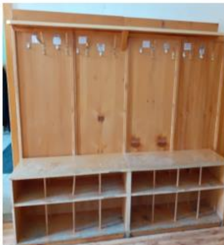
Detail staré šatny.