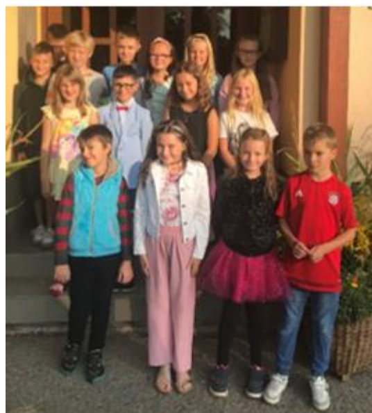
Za rok budeme ve škole nejstarší.

Do nového školního roku přeji všem dětem, jejich rodičům a zaměstnancům školy jenom to dobré.