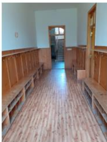
Stará šatna před rekonstrukcí.