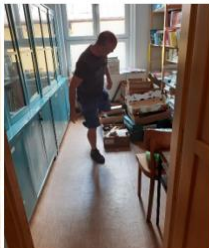
Sem se zatím stěhovalo vše, co se jinač nevešlo.