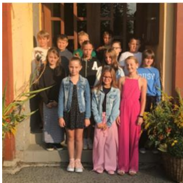
Ještě jeden rok a potom hurá do světa.